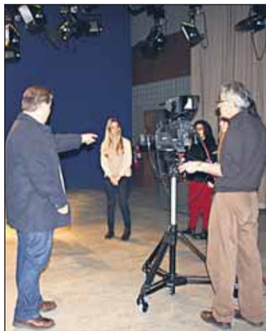
Los profesores durante una clase.