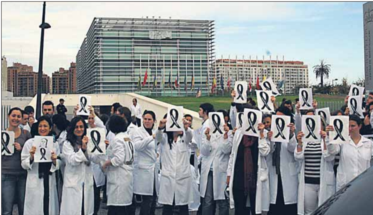
Investigadores manifestándose ante el edificio en el que trabajaban.