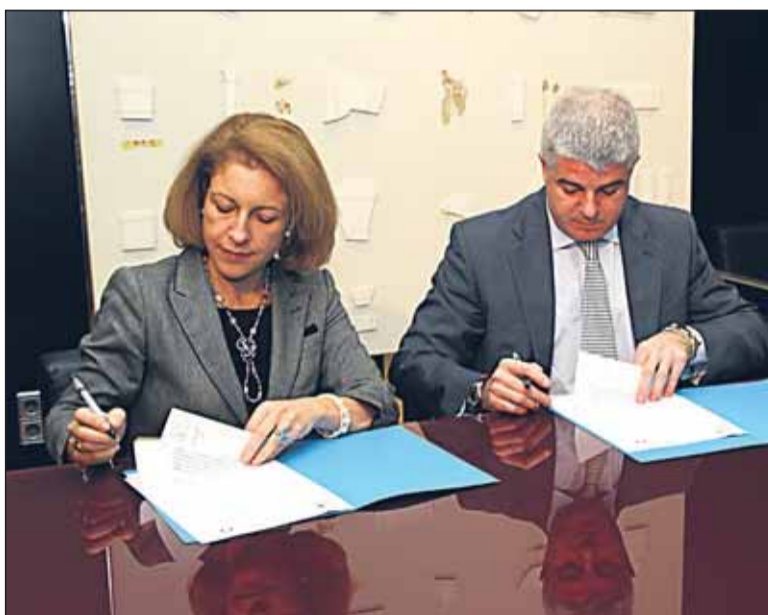
Momento de la firma entre RTVV y la Universidad.

Por su parte, la rectora de la CEU-UCH explica que este máster va a servir "para afianzar una colaboración histórica" y para que