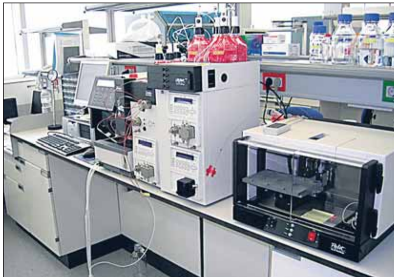
Laboratorio del Centro de Investigación Príncipe Felipe.