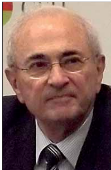
José Manuel Otero Novas.

Como ex ministro de Educación y de la Presidencia del Gobierno de Adolfo Suárez, José Manuel Otero Novas conoce a la perfección la forma de actuar en tiempos de crisis. “Hay que profundizar en las causas para atajarla lo antes posible”, argumenta. Además, el político reconoce que la sociedad “ha perdido el rumbo” y que hace falta “un mayor humanismo cristiano”. “No es fácil ser un buen católico cuando se es