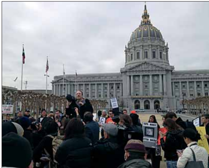
Manifestación en San Francisco contra la Ley SOPA.