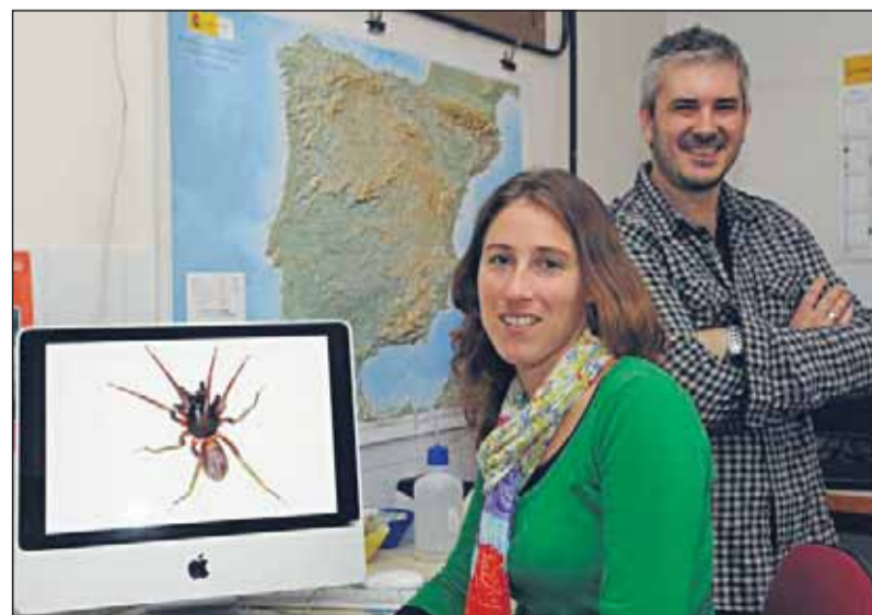
El equipo de científicos de la Universitat de Barcelona.