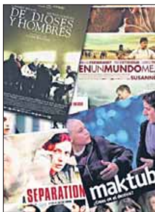
Cartel del Ciclo.

Se ha recurrido al séptimo arte para influir espiritualmente en el espectador, incitando a la reflexión sobre la vida cotidiana y los enigmas que a diario se