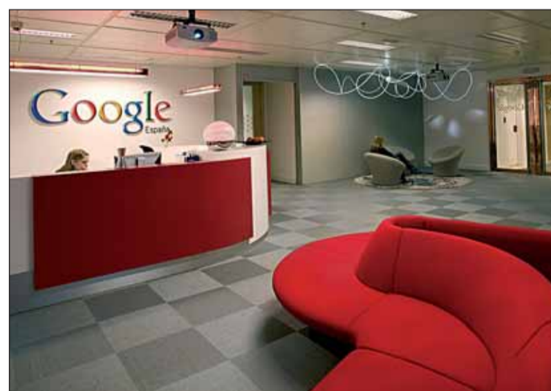
Oficinas de Google España.

Para que la seguridad sea efectiva, también se han hecho algunos cambios en la protección de datos, ofreciéndole la posibilidad al registrado de "cambiar las cosas que desee desde el panel de control, privatizando más o menos sus búsquedas y su navegación por internet", indi-