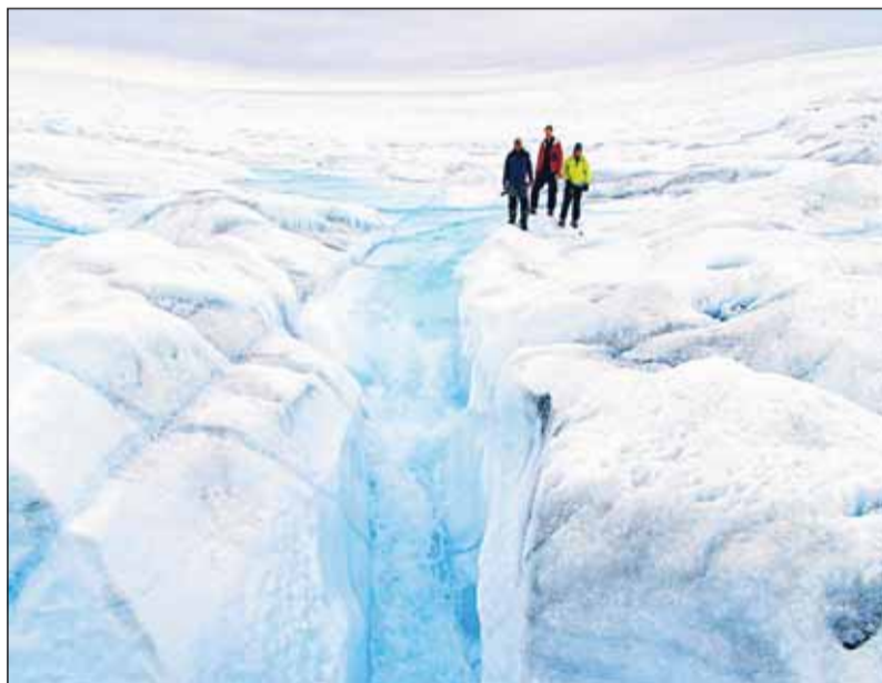
Los polos continúan fundiéndose a causa del efecto invernadero. LARIOS

Sobre las consecuencias futuras si no se revierte la situación, Larios es claro: "Es probable que la elevación de la temperatura, con los desastres climáticos, ambientales, socia-