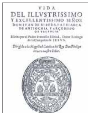
Portada del libro.

La presentación de la obra supone un broche de