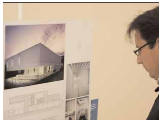
Un hombre contempla la exposición.