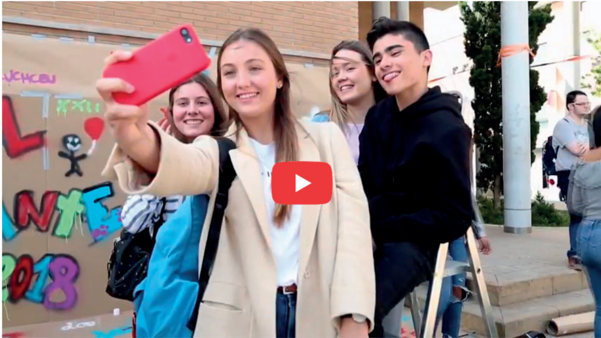
Protocolo de Prevención e Intervención contra el Acoso entre Iguales