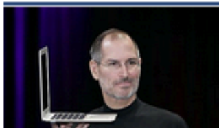
Los mejores 10 mac antivirus del 2018