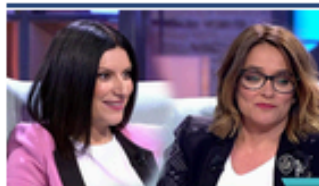
Laura Pausini y Toñi Moreno: salida del armario en directo