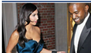
Las famosas y sus descuidos