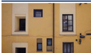
La 'casas a malicia' o el misterio de las ventanas asimétricas