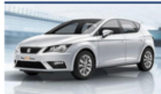
Si no quieres esperar por tu SEAT de ocasión, un Das WeltAuto es la ocasión...