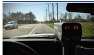
España se suma a la campaña de control de velocidad más ambiciosa de Europa