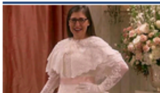
The Big Bang Theory: Mayim Bialik confiesa que no se siente cómoda con su boda en